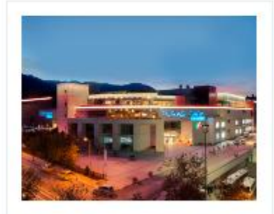
Denizli Teras Park