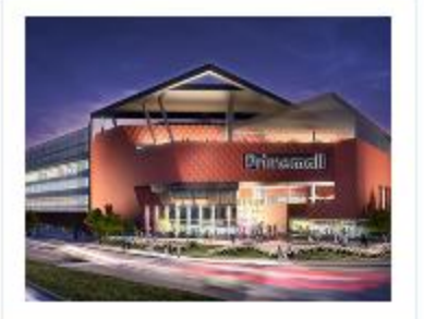
Gaziantep Prime Mall