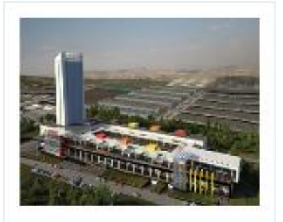
Ankara Gimart Outlet