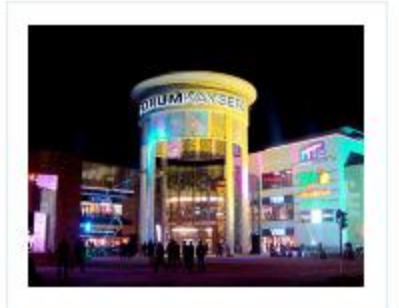
Kayseri Forum AVM