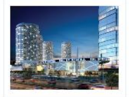
Mall of istanbul