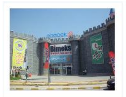
Adana M1 AVM