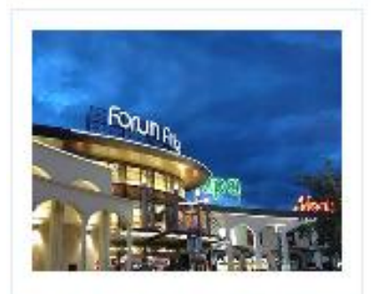
Forum Ankara Outlet