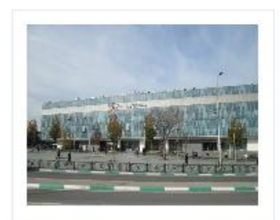
Bursa Kent Meydanı