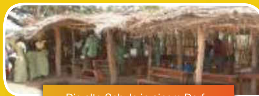
Die alte Schule in einem Dorf