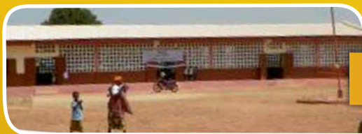
Die neue Schule im selben Dorf.