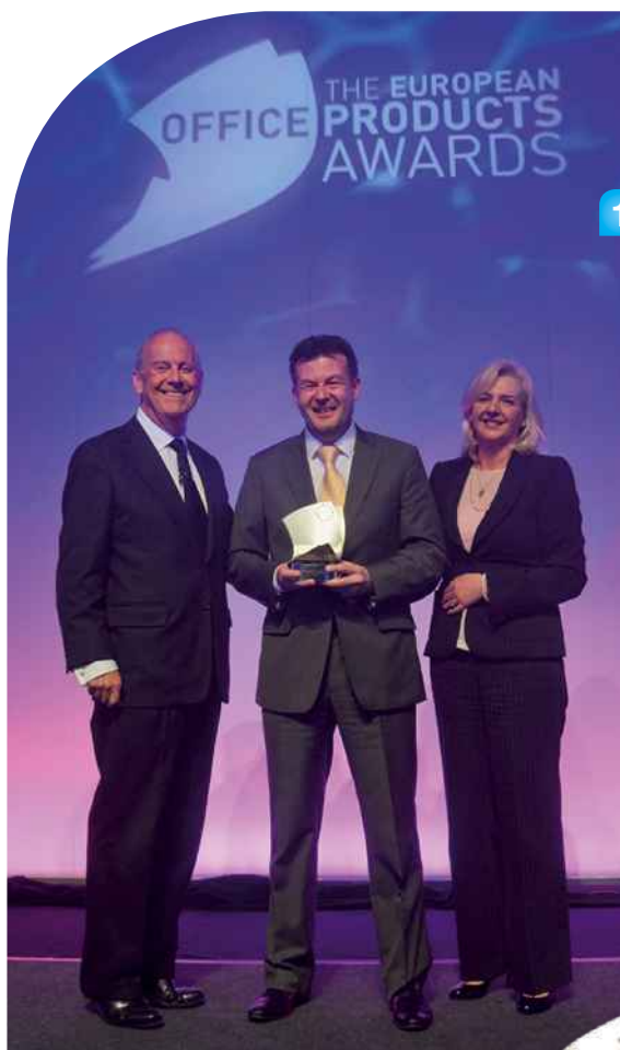
Steve Law, Lyreco CEO, mit dem Award im Rahmen der 2013 European Office Products Awards.