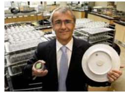
Bauscher Geschirr mit Transponder *)

Bei dem sogenannten pabis (payment-by-intelligent-solution) haben alle Geschirrtteile einen RFID-Transponder integriert, der die Speise erkennt und die Daten per Funk an die Kasse leitet. Dadurch wird der Ablauf in der Kantine beschleunigt, Warteschlangen vermieden und Kassenspersonal für andere Aufgaben verfügbar. Mit pabis light kann das System auch für den Verkauf von Speisen nach Gewicht eingesetzt werden.