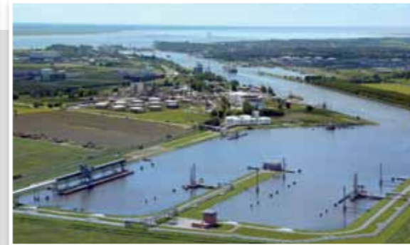
Hafen Ostermoor Port of Ostermoor