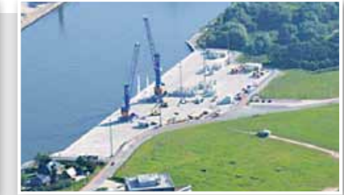
Hafen Rendsburg Rendsburg Port