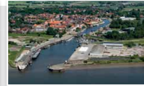
Hafen Glückstadt Glückstadt Port