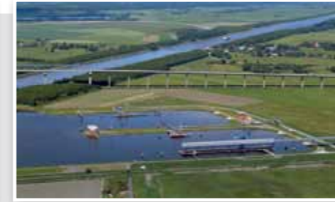
Hafen Ostermoor Port of Ostermoor