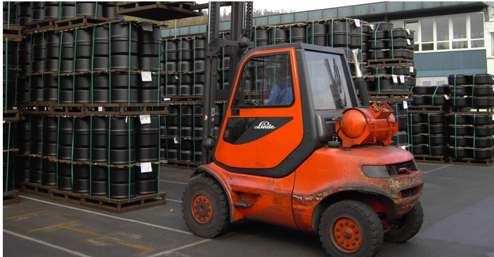
RFID Lösungen für die Intralogistik