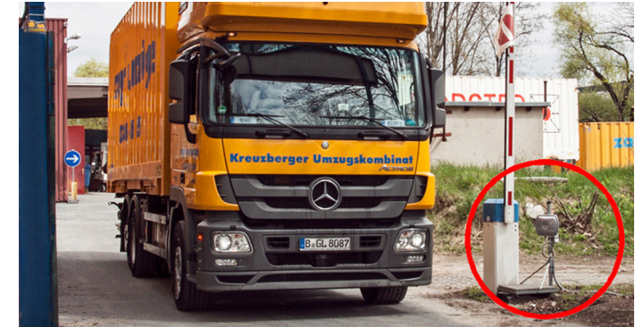
RFID Lösungen für Transport & Logistik

Abgleich der tatsächlich verladenen Ware mit dem Lieferschein. Alarmierung bei Falschbeladung des Fahrzeugs.