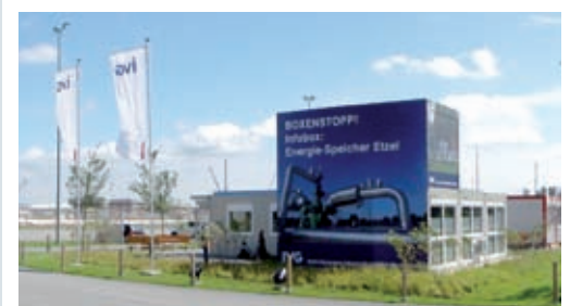
IVG Infobox am Standort Etzel